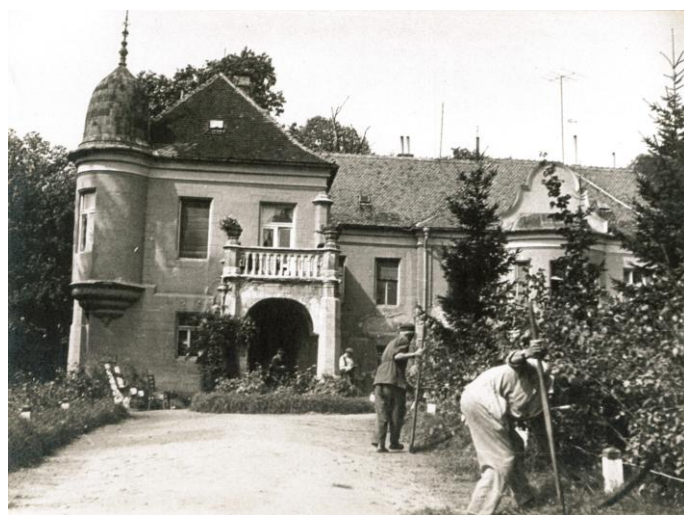
Lakók gondozzák a parkot